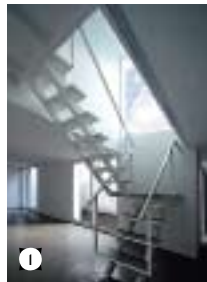
1. Лестница, соединяющая общественную зону на первом этаже с тремя спальнями на втором. 2. Патио. Слева стена, за которой находится такой же дом. Двор у них вначале был общий.

Реконструкция дома начала XX в. в центре Буэнос-Айреса. Это так называемый «дом-сосиска» – коммуналка с длинным коридором и каморками, где селились бедные иммигранты из Европы. Это очень дешевое жилье, потому что никто не хочет его покупать. Хозяева превратили его в особняк. Сохранены только внешние стены. Дом стоит в сверхплотной застройке, и свет в него поступает из патио. Чтобы было посветлее, архитекторы покрыли стены патио белой штукатуркой, добавив в нее перемолотую в крупу стеклотару.