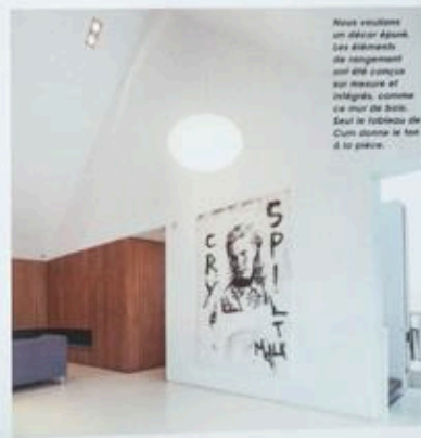
Nous voulions un éclair Apollon. Les éléments de rangement ont été conçus sur mesure et intégrés, comme ce mur de bois. Seul le tableau de Cum donne le ton à la pièce.