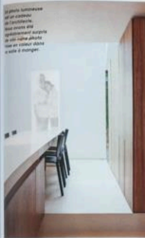
Le grand luminaires est un cadeau de l'architecte. Nous avons été également surpris de voir même pleurer dans un coin dans le site à manger.

Absolument pas. D'ailleurs, un des critères du projet était de conserver au maximum d'insolation. Le déplacement des pièces a donc été pensé dans ce sens. Les espaces de nuit se trouvent en bas et les fenêtres donnent sur le jardin. Les espaces de jour se trouvent à l'étage pour bénéficier d'un maximum de lumière.