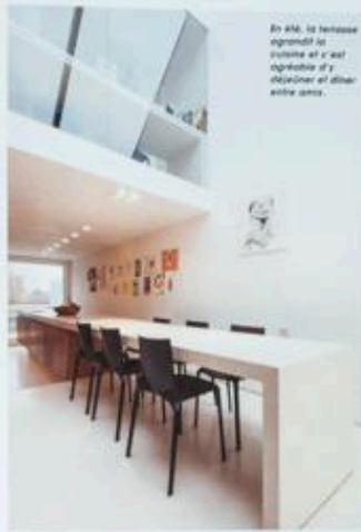
En été, la terrasse agrandit le salon et c'est agréable d'y déjeuner et dîner entre amis.