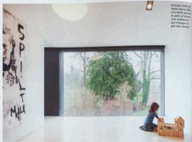
Le bois blanc de notre séjour offre une belle vue sur le parc et donne une ambiance qui change au gré des saisons.